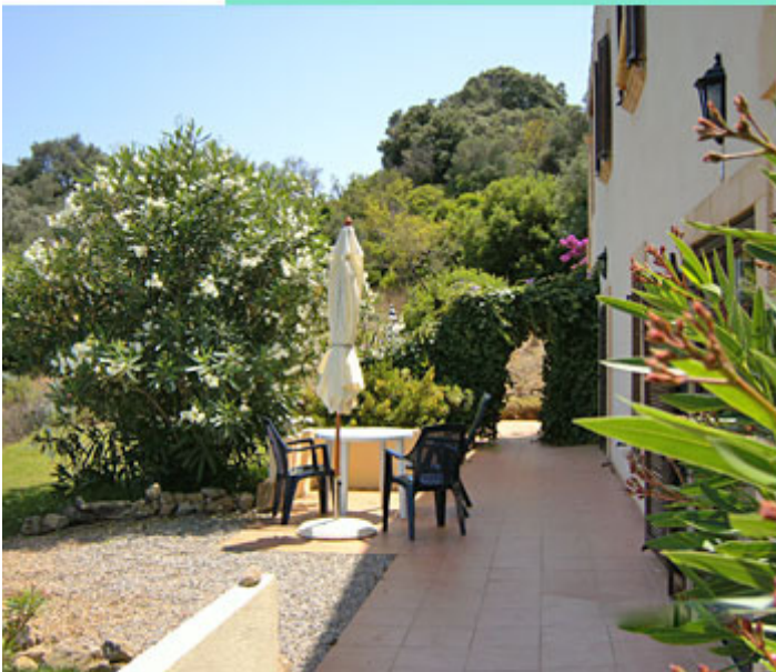
Terrasse Wohnung 1