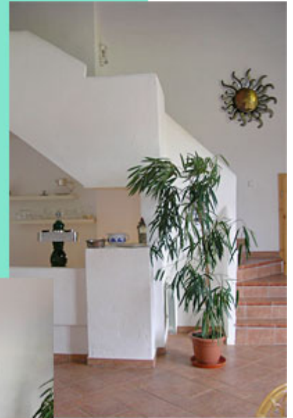
Aufgang zur Galerie