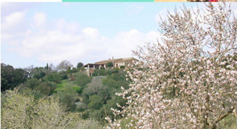
Südwest-Ansicht mit Mandelblüte