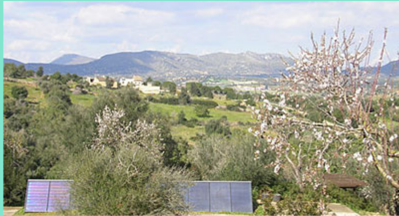
Blickrichtung Nordwest mit Teil der Solaranlage