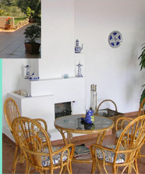
Kamin in der Halle