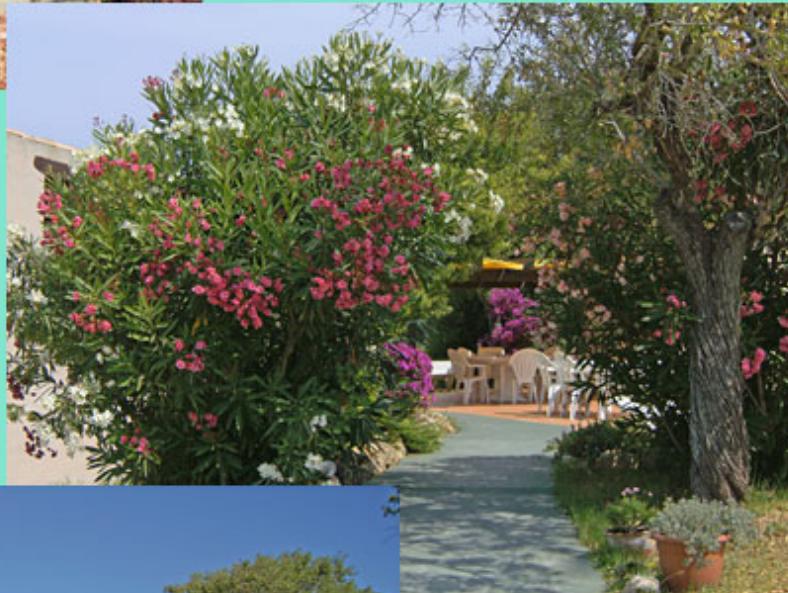
Terrasse am Pool