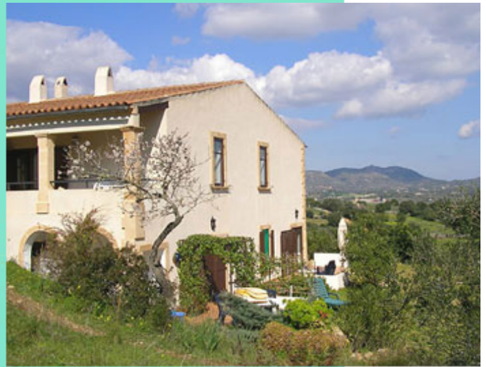
Hausansicht Ost mit Fernblick